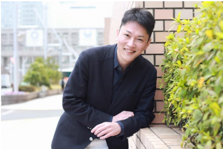
編集長近影（笑）。

世の中にはそのこと自体はすばらしい話や発想であっても、良からぬ考えを持つ人々などに都合よく解釈され、利用されるなどということがあります。